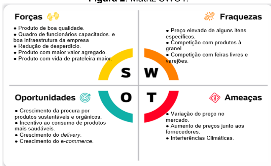
Figura 2. Matriz SWOT.

Já na figura 2 está apresentada a matriz swot com os pontos fortes e fracos e as ameaças e oportunidades para que os produtores e demais agentes da cadeia de produção que atuam com a comercialização de produtos hortícolas embalados na região utilizem como parâmetro para a organização de suas empresas.