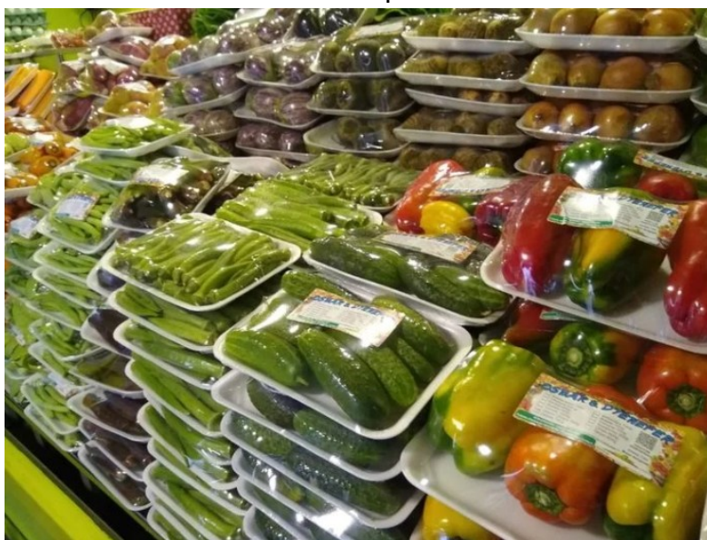
Figura 3. Produtos selecionados e embalados.

Na figura 3 temos produtos hortícolas selecionados, etiquetados e embalados como forma de agregar valor.